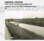
Leenbeek - Linsbeek Het na de oorlog gemiddelde vloedt over het Wilhelmskanaal.