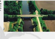
Someren De huidige brug in Someren over de Zuid Wilhelmsvaart.