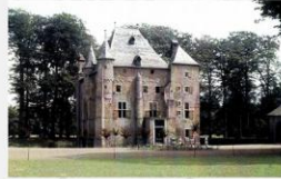
Deurne Het Groot Kasteel is een 14e eeuwse kasteel aan het Hogeland de Deurne. Opname van voor de oorlog.