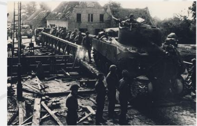
Someren De brug in Someren over de Zuid Wilhelmsvaart tijdens de operaties van de geallieerden.