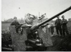
Astfel-Richtel Duits luchtschepenhuut west na de oorlog veel foto's, met vooral kinderen, van gemeenschap werden.