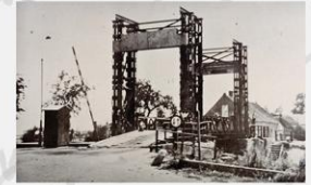
Leenbeek - Linsbeek Houding met zwaai verkeer.