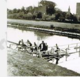
Leenbeek - Linsbeek Houding voor fietsers en voetgangers van het begin van de oorlog.