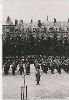
Gemert-Bakel Mobilisatie. Appel Nederlandse troepen op het Borrelplein (thans Rodeplein).