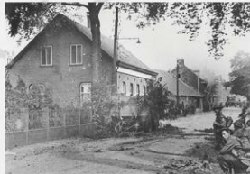
Astfel Bevrijders trekken Astfel binnen.