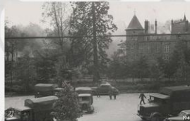
Gemert - Bakel Duitse militairen hebben hun wagens opge- steld op het Marksveld (Borrelplein, thans Rodeplein).