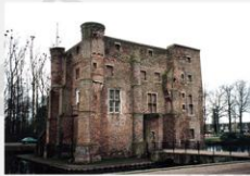
Deurne Het Groot Kasteel, halso na de oorlog het meer volledig gerestaureerd.