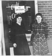
Bastel De Duitse bezetters voor- gelingen in de Tweede Wereldoorlog diverse verten als, zoals het collectief voor Joden.