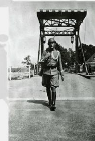
Someren De brug in Someren over de Zuid Wilhelmsvaart.