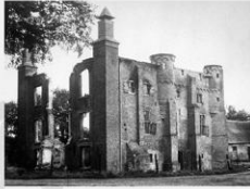
Deurne Het Groot Kasteel tijdens de oorlog van de achtergebleven getuigenis.